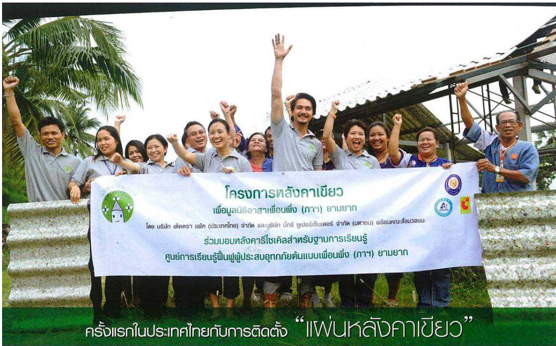
ครั้งแรกในประเทศไทยกับการติดตั้ง “หลังคาเขียว”

เมื่อพลังสีเขียวของคนไทยได้ถูกส่งไปสู่พื้นที่ประสบอุทกภัยในรูปแบบของ “แผ่นหลังคาเขียว” ที่ได้จากการรีไซเคิลกล่องเครื่องดื่มใช้แล้วจาก “โครงการหลังคาเขียวเพื่อมูลนิธิอาสาเพื่อนพึ่ง (ภาฯ) ยามยาก” หลังจากเปิดตัวโครงการฯ ได้ไม่นานก็สามารถสะสมกล่องเครื่องดื่มใช้แล้วได้ถึง 5,400,000 กล่อง นำมาผลิตเป็นแผ่นหลังคาได้ถึง 2,700 แผ่น พร้อมนำไปติดตั้ง ณ ศูนย์เรียนรู้ต้นแบบเพื่อนพึ่ง (ภาฯ) ยามยาก ตำบลบ้านแห จังหวัดอ่างทอง เพื่อเป็นต้นแบบการติดตั้งหลังคารีไซเคิลสำหรับผู้ประสบอุทกภัย และเป็นตัวอย่างในการส่งเสริมให้เกิดการจัดการกล่องเครื่องดื่มใช้แล้วอย่างยั่งยืน ในชุมชนพื้นที่ของโครงการต้นแบบฟื้นฟูประมงอุทกภัยตามแนวทางพระราชดำริเศรษฐกิจพอเพียงของมูลนิธิอาสาเพื่อนพึ่ง (ภาฯ) ยามยาก สภาเกษตรกรไทย