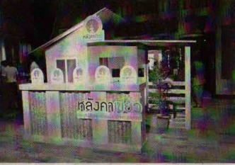
หลังคาเขียว

ให้มีการตั้งจุดรับกล่องเครื่องดื่มที่ไว้มอบแผ่นหลังคา ขยายผลเป็นความร่วมมือร่วมใจของทุกคนเพื่อให้เกิดการจัดการด้านสิ่งแวดล้อมภายในชุมชนอย่างค่อเนื่อง” มิดเดอว์ริ่งดี เด็ดตรา แพ้ค (ประเทศไทย) จำกัด โครงการ “หลังคาเขียวเพื่อมูลนิธิอาสาเพื่อนพึ่ง (ภาฯ) ยามยาก” จะดำเนินกิจกรรมที่จรรวรงค์ใจความดี และเกิดการปฏิบัติจริงในการจัดเก็บกล่องเครื่องดื่มใช้แล้วอย่างถูกต้อง จัดกิจกรรมเดินสายในสถานศึกษา และหน่วยงานต่างๆ การติดตาม