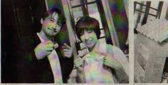
ผลและรายงานการจัดเก็บอย่างค่อเนื่อง ตลอดจนกระบวนการผลิตแผ่นหลังคา เพื่อนำไปให้มูลนิธิอาสาเพื่อนพึ่ง (ภาฯ) ยามยาก สภากาชาดไทย

กล่าวว่า ยอยากให้ทุกคนมีส่วนร่วมในการช่วยกันรักษาสิ่งแวดล้อม และปฏิบัติตามกลายเป็นส่วนหนึ่งในชีวิตประจำวัน ไม่ใช่เป็นแค่กระแสที่เกิดขึ้นแล้วก็เลิกไป ซึ่งโครงการหลังคาเขียวเพื่อมูลนิธิอาสาเพื่อนพึ่ง (ภาฯ) ยามยาก เป็นการเริ่มต้นด้วยวิสัยทัศน์จากกล่องเครื่องดื่มต่างๆ ที่เราดื่มกันทุกวันนี้ เพียงแค่ช่วยกันเก็บกล่องเครื่องดื่มใช้แล้ว ด้วยวิธีการ และล้างง่าย เพื่อให้กล่องเครื่องดื่มง่ายต่อการนำไปรีไซเคิล ดันชีวิตใหม่ให้กับกล่องเครื่องดื่มไม่ให้กลายเป็นขยะไร้ค่า เป็นการช่วยลดปัญหาภาวะโลกร้อน แล้วยังเป็นประโยชน์กับคนไทยด้วยกันเองที่ประสบกับภัยพิบัติต่างๆ โดยเฉพาะอย่างยิ่งอุทกภัยด้วย ผู้บริโภคที่สนใจร่วมโครงการ “หลังคาเขียวเพื่อมูลนิธิอาสาเพื่อนพึ่ง (ภาฯ) ยามยาก” สามารถนำกล่องเครื่องดื่มที่บริโภคแล้วไปบริจาค ณ จุดรับกล่องเครื่องดื่มใช้แล้ว มีกิสซูเปอร์เซ็นเตอร์ทั้ง 68 สาขาทั่วประเทศ ตั้งแต่เริ่มเปิดดำเนินการที่มูลนิธิอาสาเพื่อนพึ่ง (ภาฯ) ยามยาก หรือส่งไปรษณีย์ตามข้อมูลเพิ่มเติมได้ที่ โทร.02-7528575